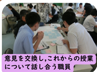
意見を交換し、これからの授業について話し合う職員

山川中と合同で授業の研修を行いました。数学の授業参観後、互いの授業スキルを高めるために、熱心に話し合いました。充実した会となりました。